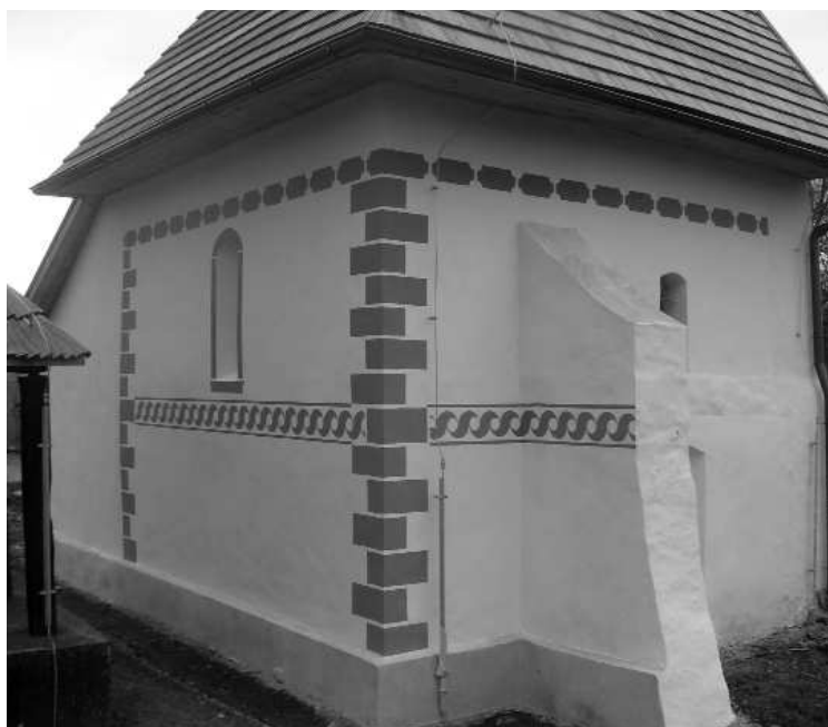
A megújult templomrom